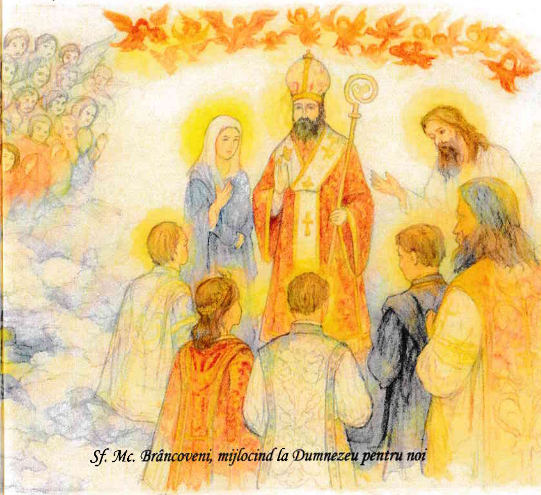
Sf. Mc. Brâncoveni, mijlocind la Dumnezeu pentru noi

Peste secole, prin pilda vieții lor, ortodoxia a dăinuit și înflorit în toate cele trei principate române: în Țara Românească, în Moldova și în Ardeal.