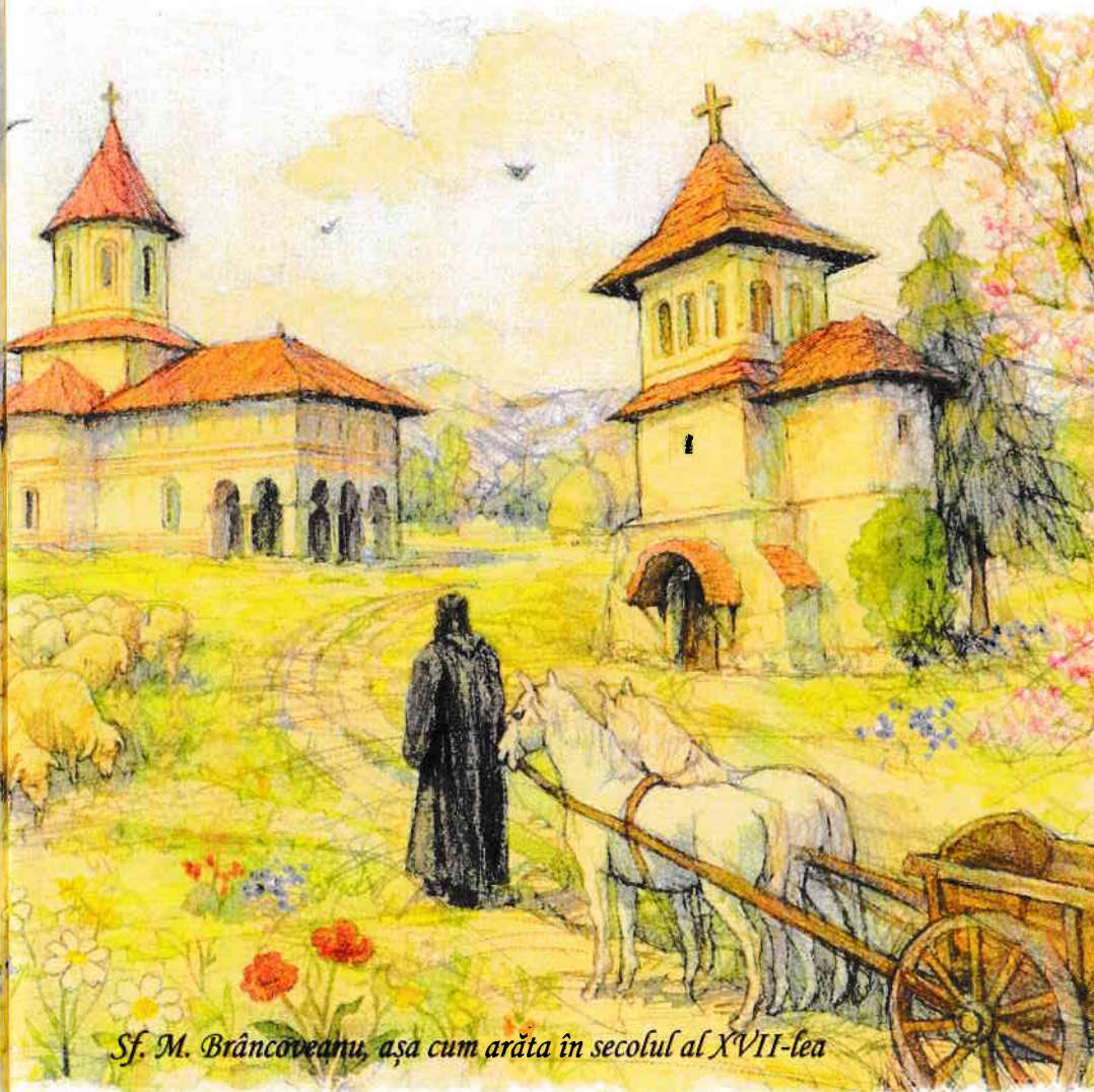
Sf. M. Brâncoveanu, așa cum arăta în secolul al XVII-lea

cei de pe pământ în acest moment, ci legătura noastră, prin Dumnezeu, depășește timpul prezent și suntem uniți chiar și cu cei care și-au urmat cursul vieții lor și s-au întors la Dumnezeu, iar aceștia sunt mai ales Sfinții și intrăm în legătură directă cu ei de îndată ce ne rugăm lor și când ne închinăm chipurilor lor pictate pe icoane.